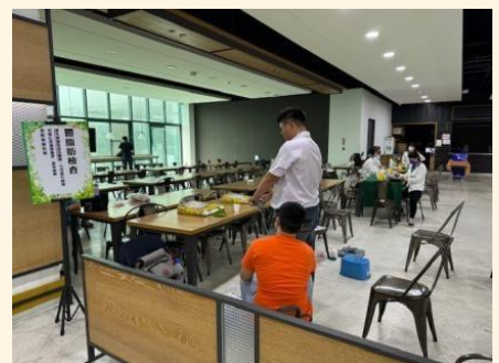
▲年度員工健康檢查

可成與成功大學醫院之職業醫學專科醫師建立長期合作關係，透過醫師駐廠服務機制，提供同仁即時醫療諮詢與轉介服務，並主動評估作業環境可能衍生之健康風險。另每年與專業醫療機構合作，針對一般作業及特殊危害作業之在職員工辦理定期健康檢查，其檢查頻率與項目均優於當地法規規定。公司並依健康檢查結果建立健康風險分級管理機制，安排醫師進行後續追蹤與專業評估，並由專職護理人員依體檢報告提供適切之健康教育與關懷服務；同時結合職業醫學臨場服務，持續為員工提供完善且周延之健康諮詢與支持機制。